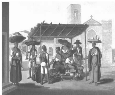
DEBRET, J. B.; SOUZA, L. M. (Org.). História da vida privada no Brasil : cotidiano e vida privada na América Portuguesa, v. 1. São Paulo: Companhia das Letras, 1997.